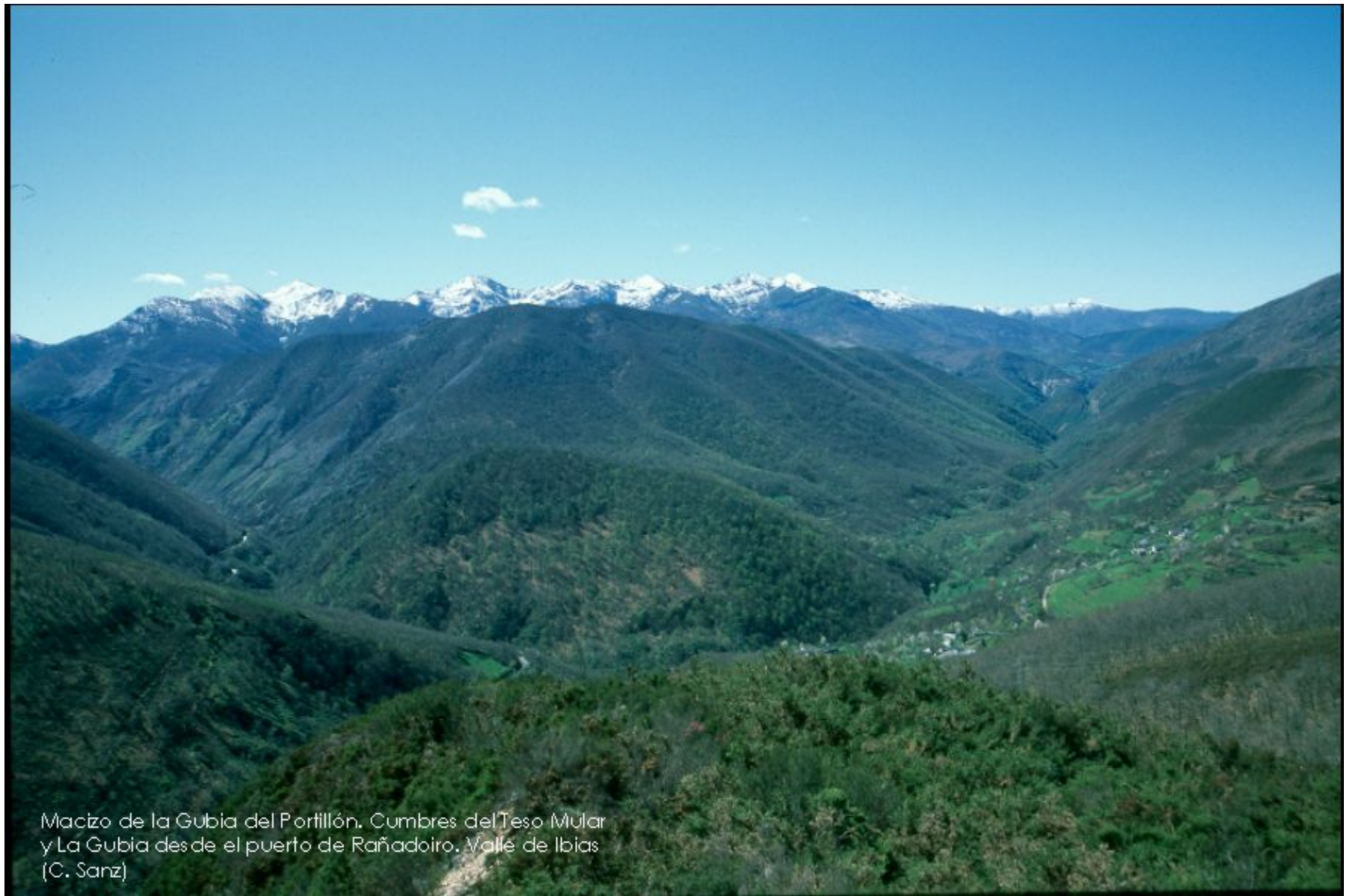
Macizo de la Gubia del Portillón. Cumbres del Teso Mular y La Gubia desde el puerto de Rañadoiro. Valle de Ibañeta (C. Sanz)

La agricultura en el norte peninsular se desarrolla en el fondo de los valles y se centra en los cultivos de huerta.